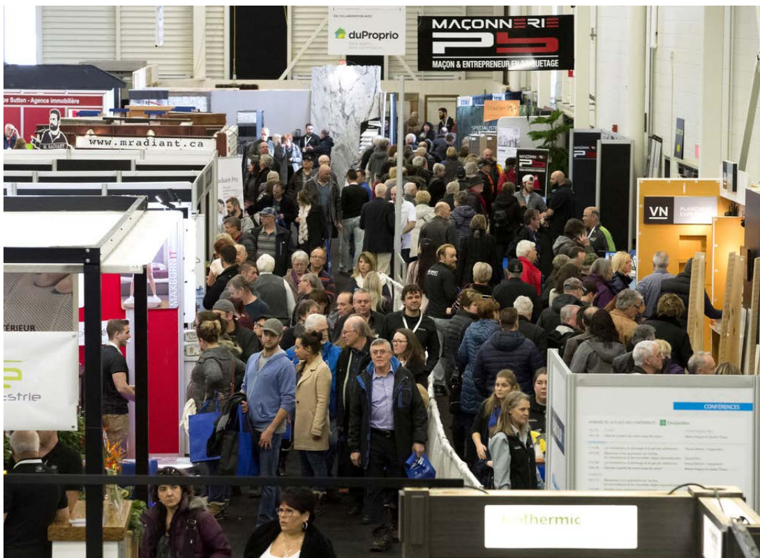
— SPECTRE MÉDIA, MAXIME PICARD